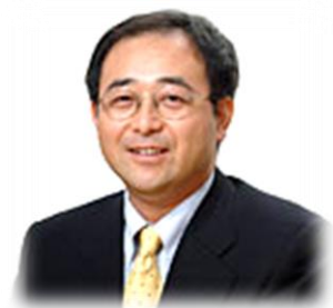
明蓬館高等学校 学校長 明蓬館 SNEC 総センター長 アットマーク国際高等学校 学校長